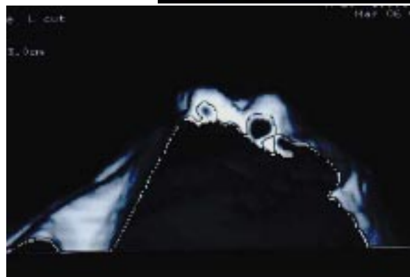
三次元CT画像による気胸断面画像